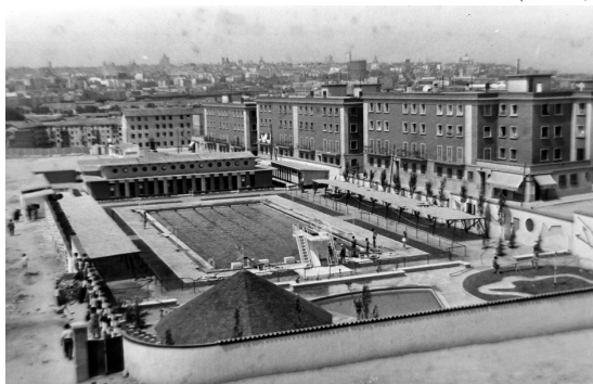
Piscina municipal de Usera en la colonia Moscardó (1959, Santos Yubero).