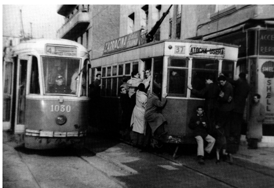
Línea de tranvía número 37 Atocha- Usera (1949)

En estas páginas también veremos los estragos de la guerra civil, ya que Usera constituye la línea que separa los dos bandos. Como consecuencia de ella, en 1939 comienza la reconstrucción edificándose colonias, colegios, dispensarios, etc. muchas veces impulsada por los propios vecinos (merece la pena llamar la atención en este sentido, por el movimiento vecinal de Orcasitas). La obra termina con un capítulo titulado “Usera siete estrellas” en el que se ven reflejados los siete barrios que actualmente conforman el distrito. Un libro necesario para poner en valor el pasado y el presente del sur de Madrid.