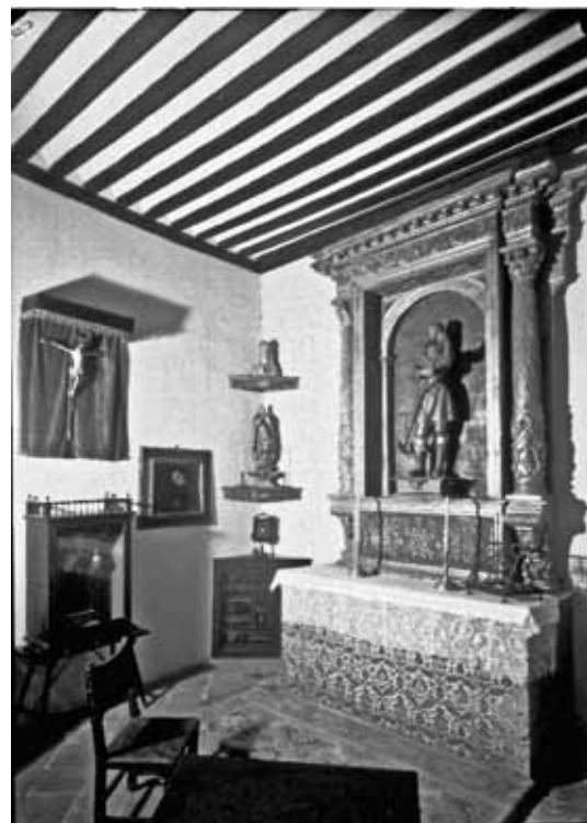
San Isidro. Interior, Fondo Moreno, Sig. 35031-B Fototeca del Centro de Restauraciones Artísticas.