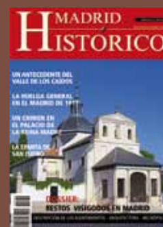
Ermita de San Isidro del Campo.

Las responsabilidades derivadas de texto e imágenes corresponde a los autores de los artículos