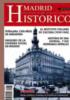
Edificio de La Equitativa

Las responsabilidades derivadas de texto e imágenes corresponde a los autores de los artículos