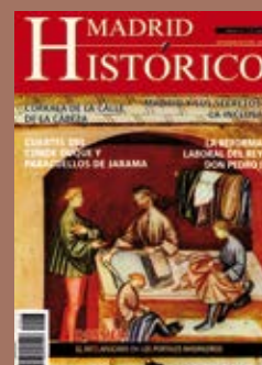
Alfayate o sastre medieval