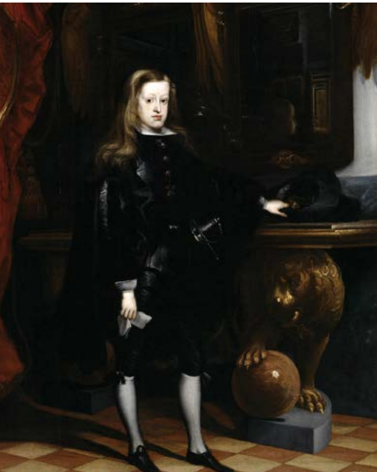
La baronesa estuvo en Madrid durante el reinado de Carlos II. Retrato de Carreño de Miranda. Museo del Prado, Madrid.

La capilla de San Isidro es entre todas la más bella. San Isidro, patrón de Madrid, era un pobre labrador; los muros de su capilla están incrustados con mármoles de colores;