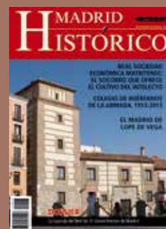
Casa y torre de los Lujanes