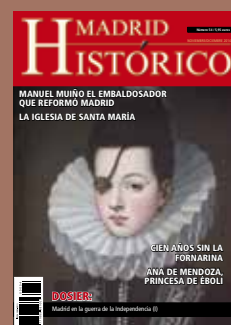
Retrato de doña Ana de Mendoza, casa del Infantado.

Las responsabilidades derivadas de textos e imágenes corresponden a los autores de los artículos.