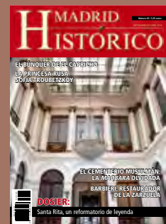
Vestíbulo central de la Real Academia de Medicina de Madrid.

Las responsabilidades derivadas de textos e imágenes corresponden a los autores de los artículos.