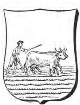
Escudo de Aravaca

Se piensa que Aravaca surge de la colonización madrileña llevada a cabo en la vertiente meridional de la Sierra de Guadarrama. Las primeras referencias históricas las encontramos en 1222, año en el que el rey Alfonso VIII