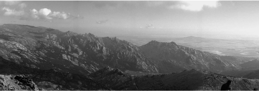
▲ El río desciende de la Maliciosa hacia la Pedriza.