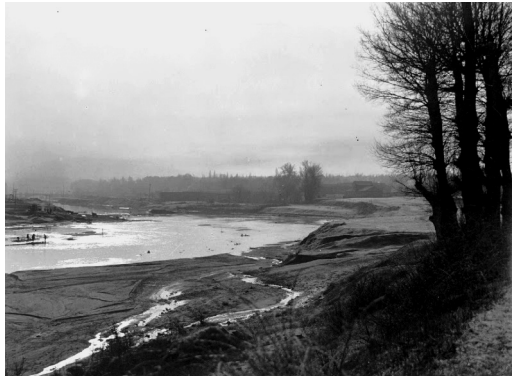
▲ Fotografía de Wunderlich hacia 1920.