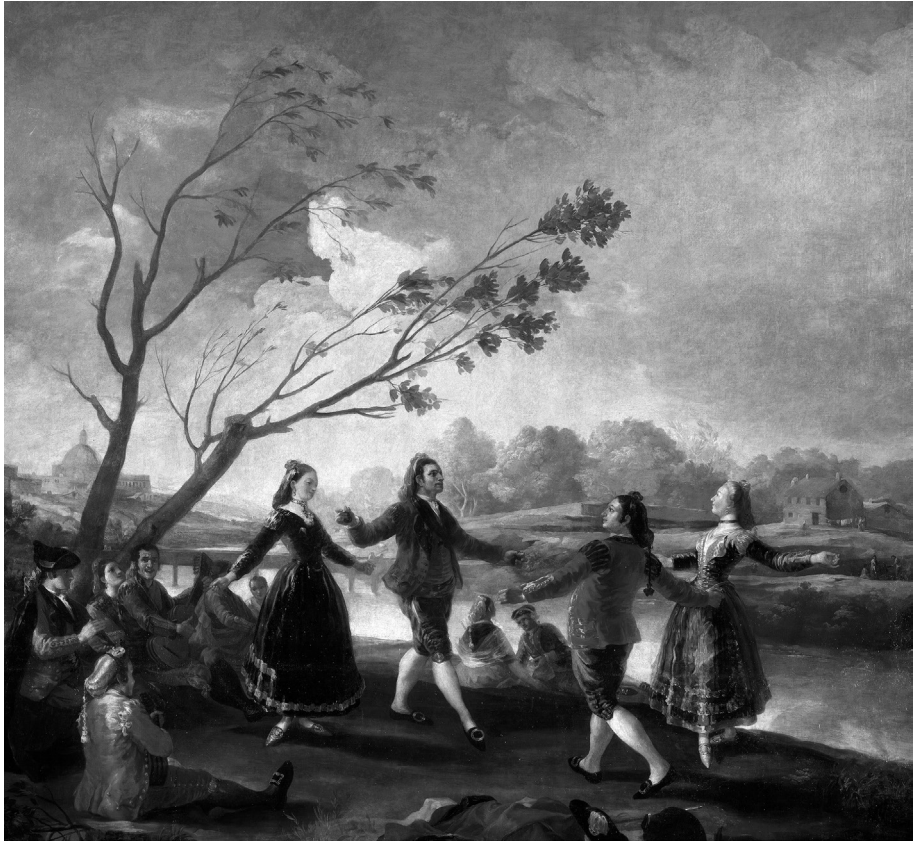
▲ Baile en el Manzanares, de Goya.

quieran poner, pero que significan también un cambio de talante hacia la valoración del espacio natural sobre el que torpemente nos desenvolvemos.