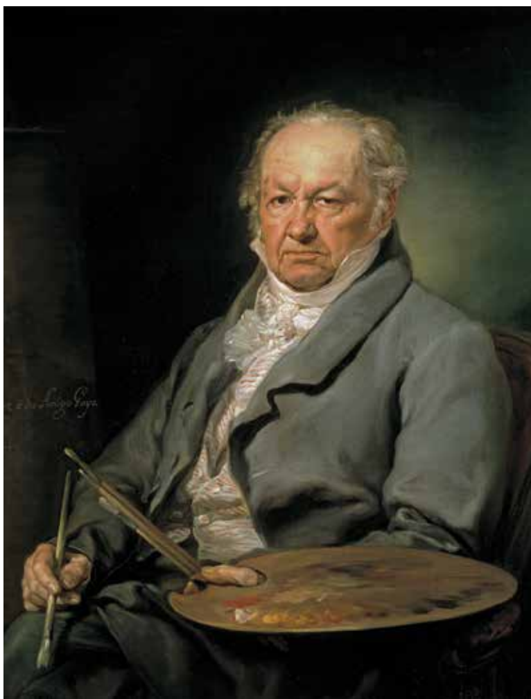
AGRADECEMOS LA COLABORACIÓN PRESTADA PARA LA ELABORACIÓN DE ESTE NÚMERO

Madrid suele ser identificada como el mayor mercado de vino de España. Sin embargo, no es menos cierto que a lo largo de su historia ha sido un enclave fundamental para el desarrollo del sector vitícola y las enseñanzas relacionadas con él. En la actualidad posee el herbario de vid más antiguo del mundo, una de las bodegas más antiguas de España y la mayor colección de plantas vivas de vid de nuestro país. Además, desde 1990 cuenta con la Denominación de Origen Vinos de Madrid.