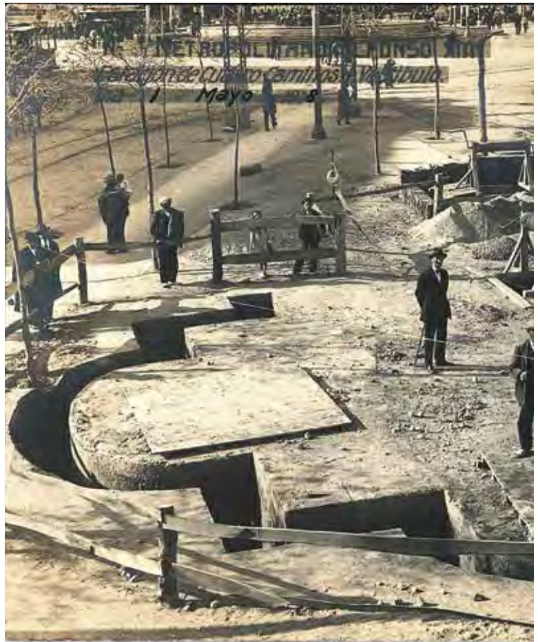
AGRADECEMOS LA COLABORACIÓN PRESTADA PARA LA ELABORACIÓN DE ESTE NÚMERO

En estas páginas os traemos la historia de la Colonia Rubio, un lugar de veraneo creado en Guadarrama a principios del siglo xx, aprovechando la inmediatez de las aguas de La Porqueriza, que durante unos cuantos años fue el lugar de moda y de referencia en el turismo madrileño y del que ya nada queda en pie.