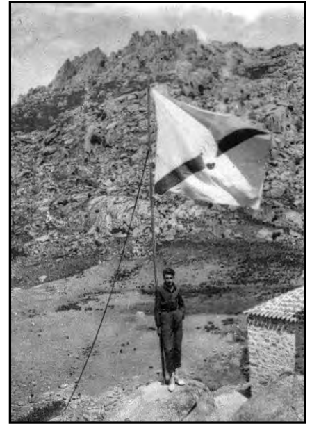
Izado de la bandera el día de la inauguración del refugio Giner en la Pedriza, año 1916