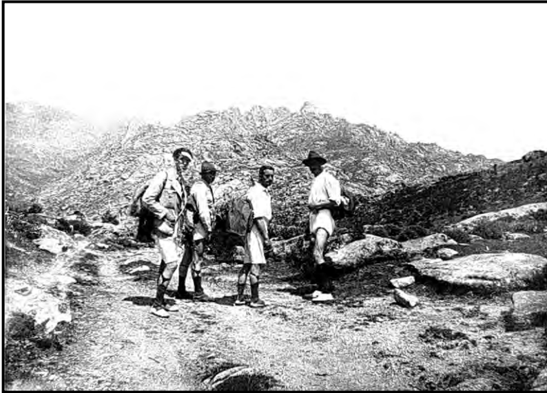
Collado de Quebrantaherraduras año 1914