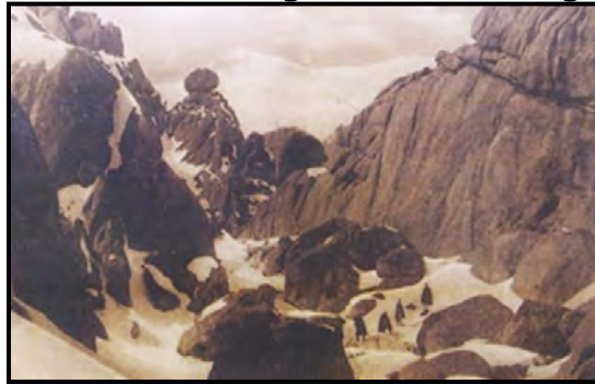
Excursionistas en la Pedriza, en el invierno del año 1916