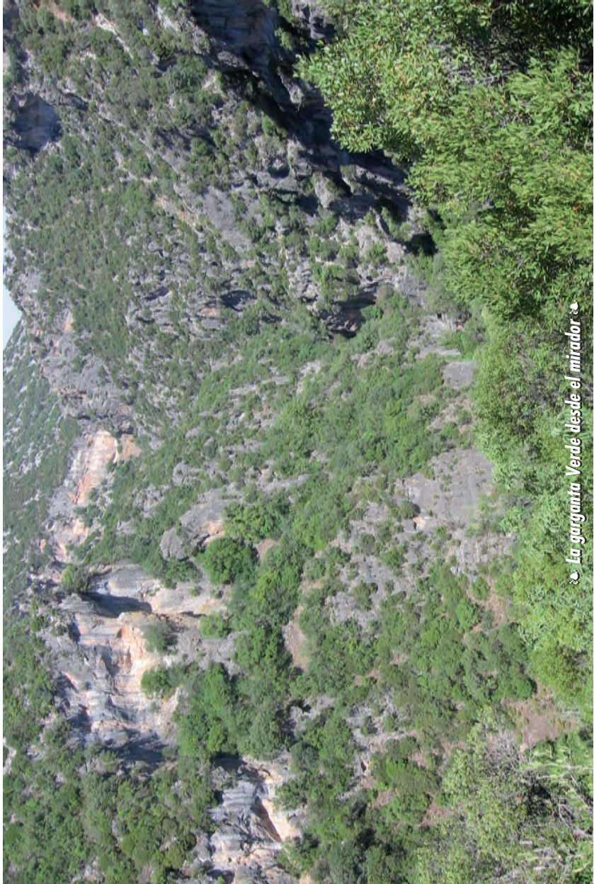
La garganta Verde desde el mirador