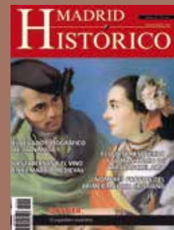
Personajes populares, de Tiépolo