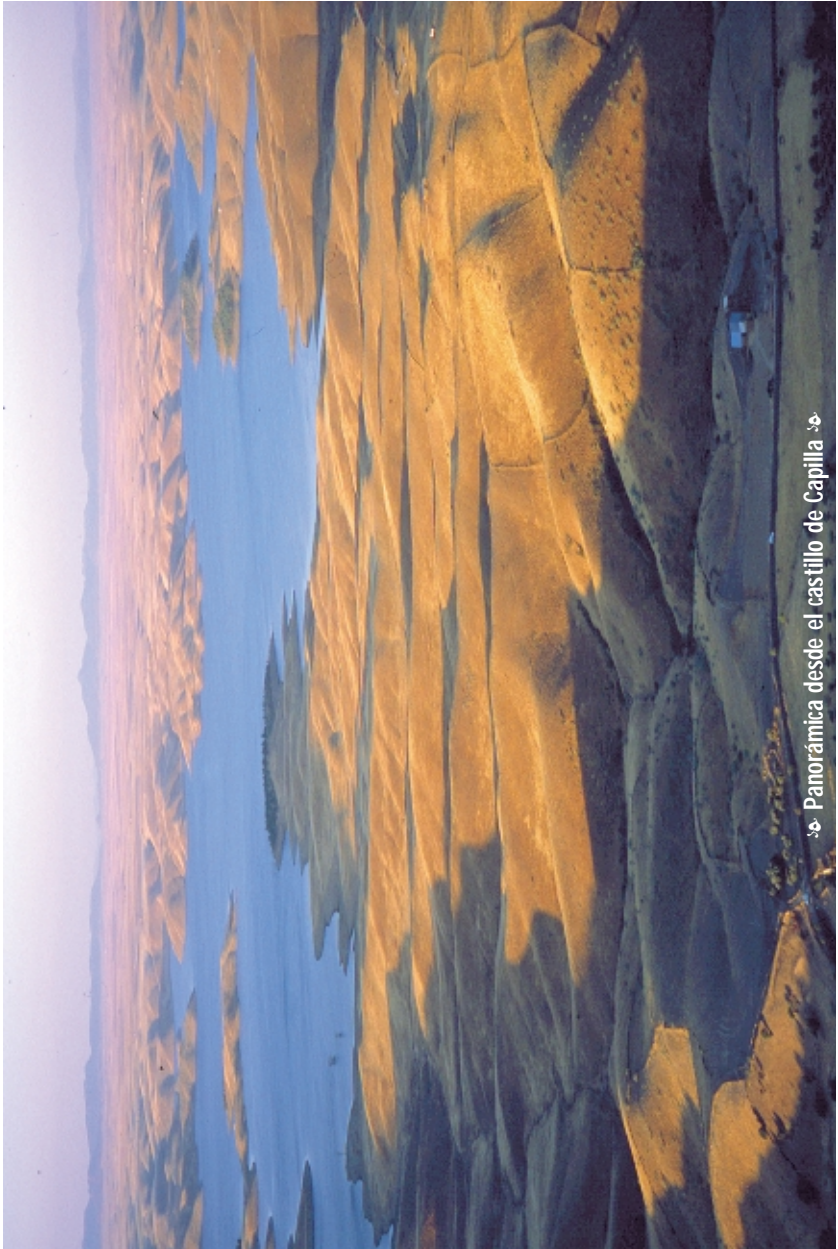
☞ Panorámica desde el castillo de Capilla ☞