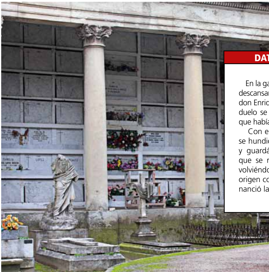
Galería V de la sacramental de San Isidro, ya reconstruida