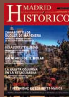
Belén de la Asociación de Belenistas