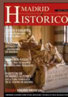
Mausoleo de Sagasta Panteón de Hombres Ilustres

Depósito Legal: M-47103-2005/1.S. S.N. 1885-5814