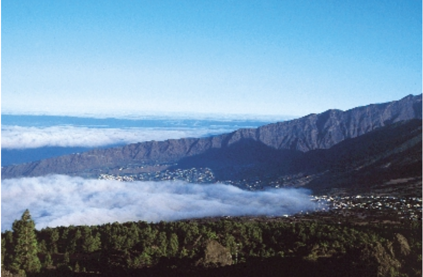
🌿 El Tíme y Aridane en la ascensión al Birigoyo 🌿

ascenso, hasta el ansiado refugio del Pilar, nuestro fresco inicio y fatigoso fin.