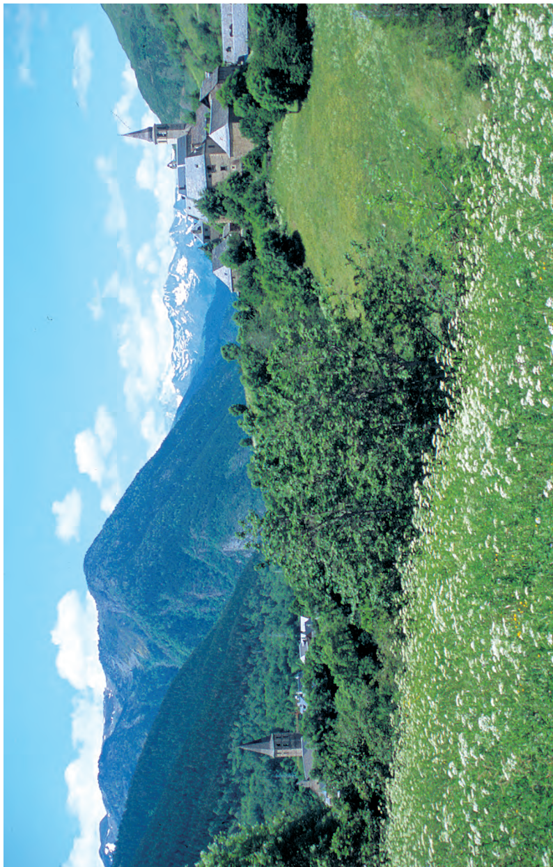
• Las iglesias de Unha y Salardú con La Maladeta como telón de fondo, una imagen clásica •