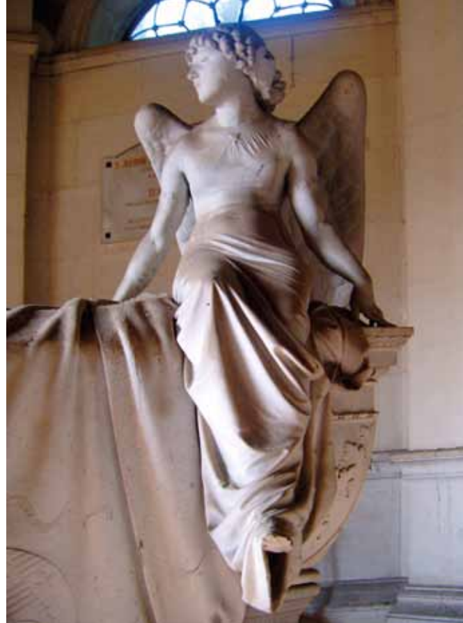
Interior del panteón familiar De la Gándara Sacramental de San Isidro

Escultura de Giulio Monteverde, Roma, 1883