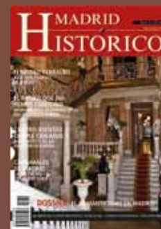
Escaleras de acceso al Museo Cerralbo