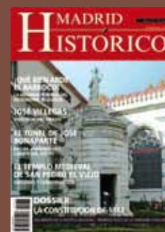
Mausoleo de la Libertad

Depósito Legal: M-47103-2005/ I.S.S.N. 1885-5814