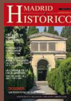
Acceso Sacramental de San Isidro