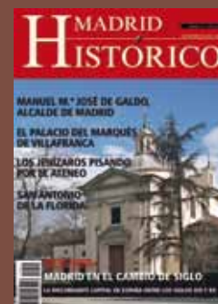
Ermita de San Antonio de la Florida

Depósito Legal: M-47103-2005/ I.S.S.N. 1885-5814