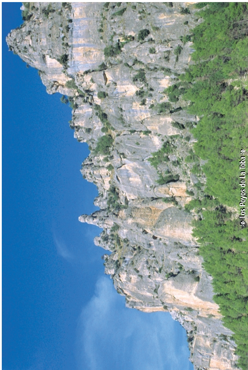
Los Poyos de La Toba