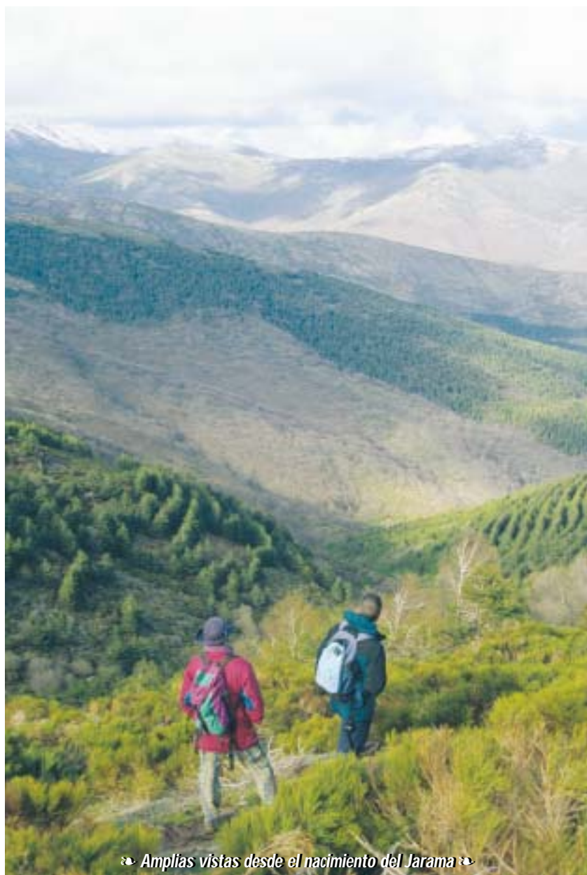
Amplias vistas desde el nacimiento del Jarama