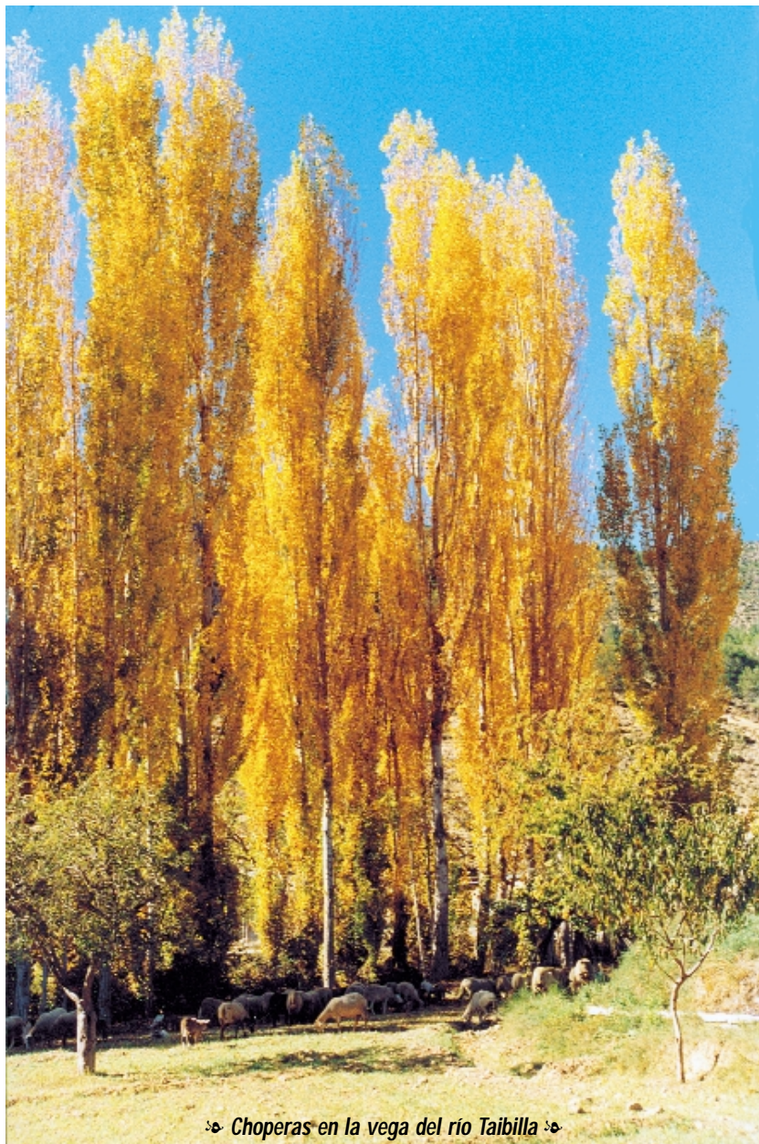
☞ Choperas en la vega del río Taibilla ☞