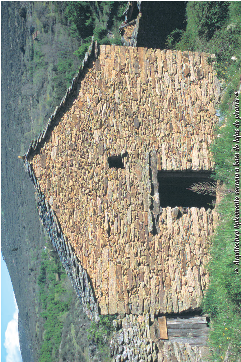
Arquitectura típicamente serrana a base de lajas de pizarra