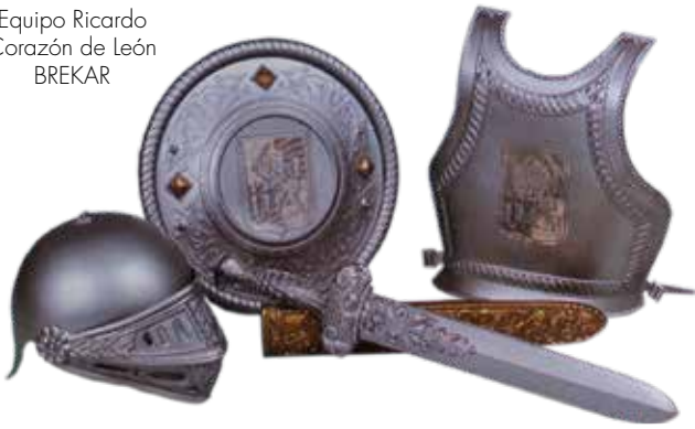
Equipo Ricardo Corazón de León BREKAR