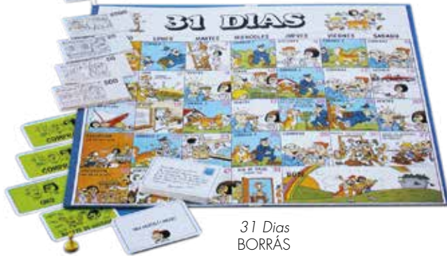
31 Dias BORRÁS