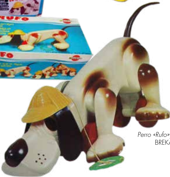
Perro «Rufo»y «Rufito» BREKAR