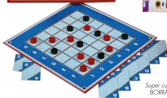
Super cuatro BORRÁS