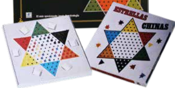
Estrellas chinas/Damas chinas BORRÁS