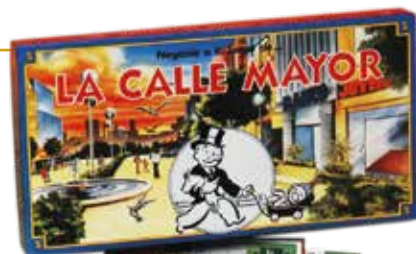
La Calle Mayor BORRÁS