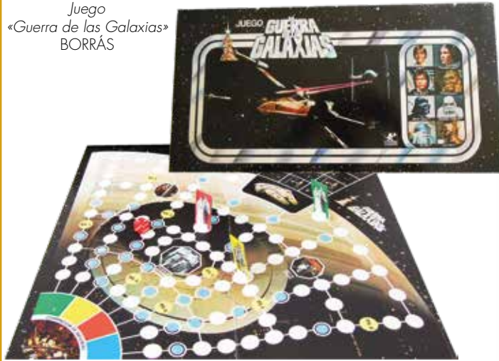
Juego «Guerra de las Galaxias» BORRÁS