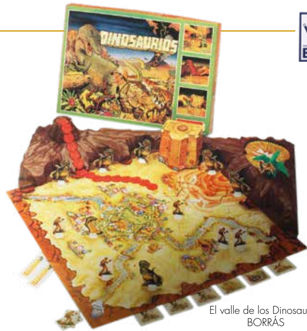
El valle de los Dinosaurios BORRÁS