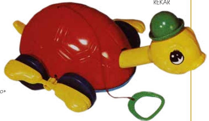
Tortuga Tula REKAR