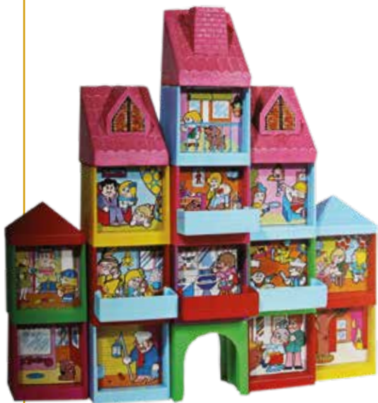
Modulín «Serie Castillo» BREKAR