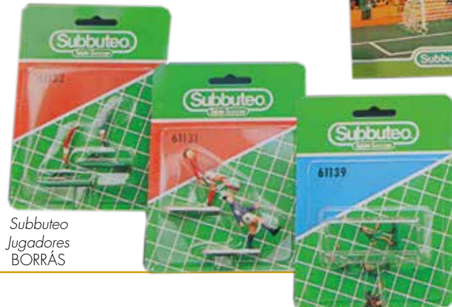
Subbuteo Jugadores BORRÁS