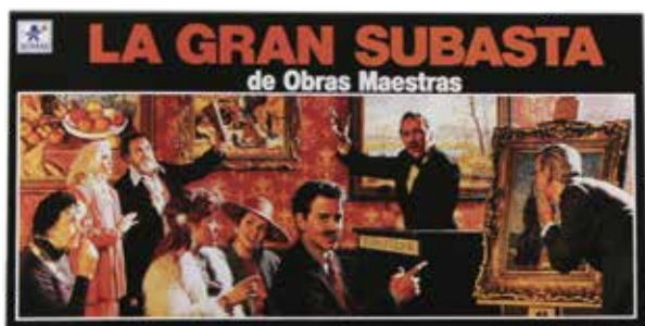
Gran Subasta BORRÁS