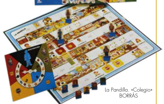
La Pandilla. «Colegio» BORRÁS