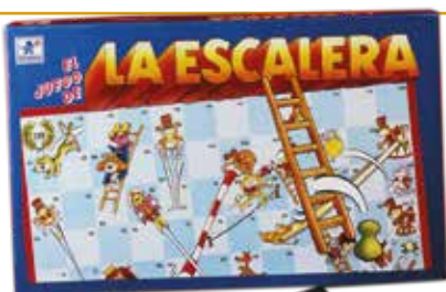
La escalera BORRÁS