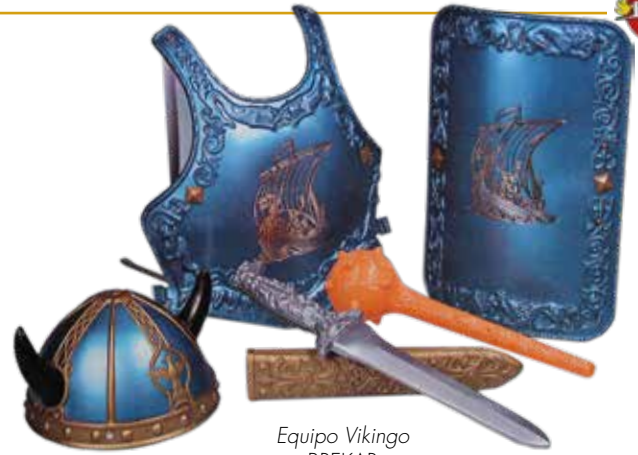
Equipo Vikingo BREKAR