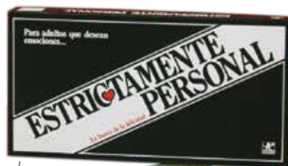
Estrictamente personal BORRÁS