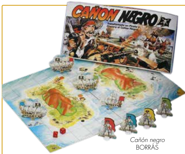
Cañón negro BORRÁS