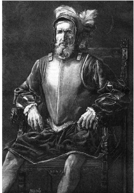
Miguel López de Legazpi, conocido como el Adelantado.

A finales del siglo XIX ya existía la plaza conformada por el cruce del paseo de las Delicias con el paseo de la Chopera y el paseo del Molino, pero no tenía ningún nombre específico. Hubo que esperar al 14 de julio de 1926, cuando el Ayuntamiento decidió que se denominase plaza de Legazpi en homenaje al fundador de Manila, Miguel López de Legazpi. Este navegante español, nacido en Zumárraga en 1510 y fallecido en 1572, tomó parte en varias expediciones desde México, donde ocupó varios cargos relevantes. Conocido como el Adelantado, llegó a las islas Filipinas al frente de la expedición organizada por Luis de Velasco y fray Andrés de Urdaneta. Fundador de la Manila española en 1571, fue el primer gobernador de la Capitanía General de las Filipinas