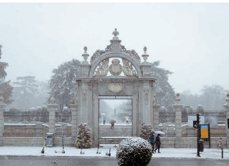
La Puerta de Felipe IV durante la borrasca Filomena. Julia Marquerie, 2021.

Hubo un tiempo en que los reyes daban la bienvenida a la Villa y Corte a sus reinas consortes construyendo puertas conmemorativas. Muchas fueron levantadas como arquitecturas efímeras, por lo que, como su nombre indica, no tardaron en ser destruidas. Sin embargo, en otras se emplearon materiales duraderos para que formaran parte de complejos palaciegos, dándoles así una función utilitaria más que de festejo. Este es el caso de la Puerta de Felipe IV.