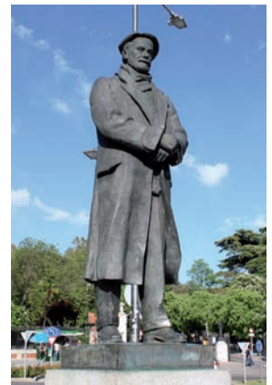
Monumento a Pío Baroja.

Y nada, sin duda, agradaría más al insigne político que saber que la calle dedicada a su memoria se ha convertido en un paraíso de la lectura, donde el libro es el rey y protagonista absoluto. Por su cercanía a la estación de Atocha, hasta allí llegaban los puestos de una feria tradicional. Y en Moyano no eran precisamente libros los que se vendían a finales del siglo XIX, sino más bien botijos, cestas de esparto y otros útiles. Muy cerca, en la entrada principal del Jardín Botánico, se situaban los libreros a comienzos del siglo XX, pero el Ayuntamiento decidió en