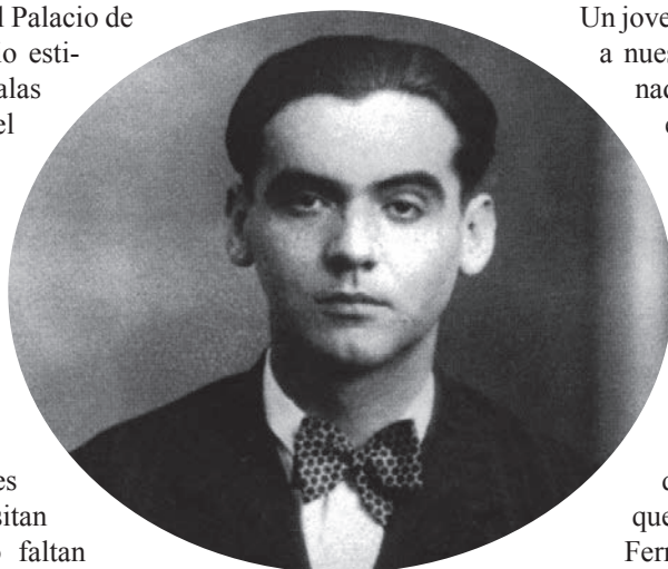
García Lorca en su adolescencia.

Fernando de los Ríos había sido su profesor en la Universidad de Granada y