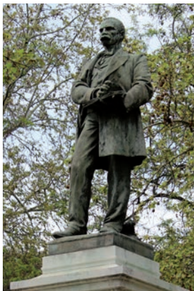
Estatua de Claudio Moyano.

Acercarse, por ejemplo, a la Cuesta de Moyano en una tarde luminosa y pasear sin prisa —fundamental— es una delicia al alcance de cualquiera. Desde el paseo del Prado a la calle Alfonso XII, sube la calle de Claudio Moyano, más conocida como la Cuesta de Moyano por su pronunciada pendiente. Pegada a la tapia del Jardín Botánico, la cuesta ha cambiado su fisonomía recientemente, una vez más, de las varias que ha sufrido transformaciones desde que se decidió eliminar los coches y devolver al peatón todo el espacio, en un anticipo —tanto en pavimentos como en farolas, bancos y resto de mobiliario urbano— de lo que será algún día, si la política y la burocracia no continúa impidiéndolo, la remodelación del eje Prado-Recoletos.