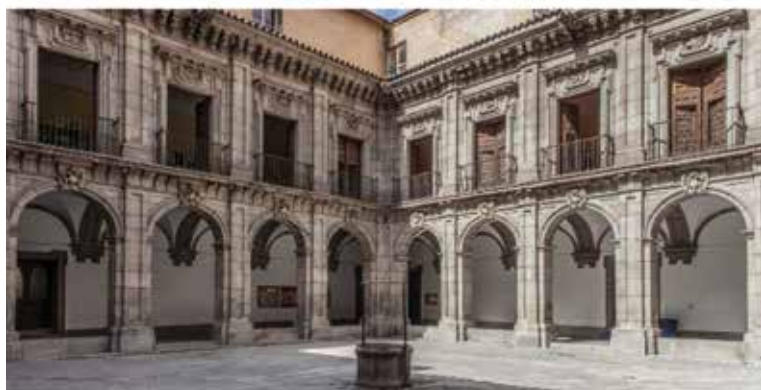
Fachada y claustro del Colegio de San Isidro.