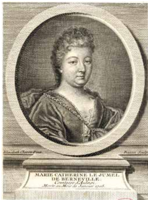
Retrato de la condesa d'Aulnoy

Madrid ha sido desde muy antiguo un poderoso imán que ha atraído hacia sí no solo a gentes de todos los puntos de España, sino también a muchos extranjeros sobre los que ha ejercido una extraña y a veces una contradictoria influencia. A lo largo del tiempo a unos les ha subyugado por la límpida y azul belleza de su cielo, por la pureza de su aire, sutil y transparente, por su cordial hospitalidad; a otros, por el contrario, les ha repelido por la suciedad y el hedor de sus calles —famosas precisamente