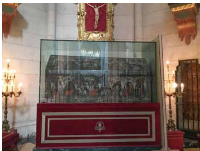
Catedral de la Almudena.

El arcón es de madera de pino, revestido de cuero estucado, sobre el que se presentan las pinturas bajo arcos góticos, en un estilo muy similar al que recogen las ilustraciones de las Cantigas de Santa María de Alfonso X el Sabio. Ha sufrido varias restauraciones, la última en época reciente. Los restos del santo se encuentran en la colegiata de San Isidro de la calle Toledo, protegidos en una urna de plata que construyeron los orfebres del siglo XVII con motivo de su canonización. A esta iglesia mandó trasladar las reliquias Carlos III en 1726, junto con las de su mujer santa María de la Cabeza. Desde entonces han permanecido allí expuestas a la veneración de los madrileños, menos en el periodo de la Guerra Civil, que se ocultaron para evitar su profanación.